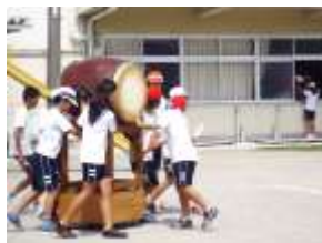
↑ たいこの準備も協力して

台風 18 号の被害は、他の地域に比べれば大きくなかったのですが、ヘチマ棚が倒壊、運動場の落羽松の枝折れと葉や実の落下がありました。写真は 17 日朝、職員が片付けをしているところです。登校してきた 6 年生も加わり、早くすみしました。その後、運動会用のラインを引いて、練習準備が整えました。