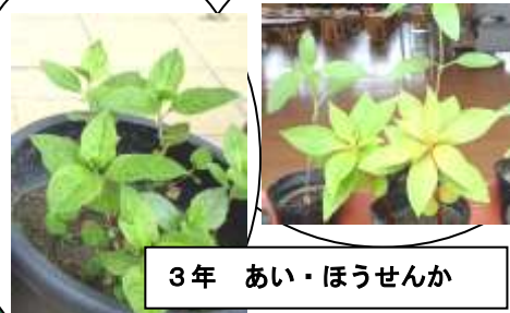
3年 あい・ほうせんか