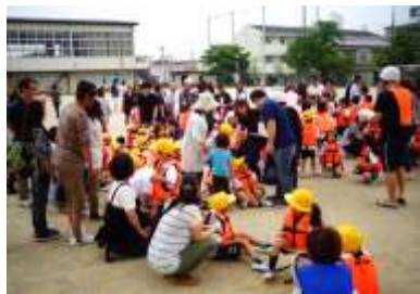
順に確認していきます。

には、子どもたちの横に座って担任の確認を受けていただいたり、移動して地区別に並んでいただいたりしました。いざというときの大事な確認を、子どもとともに経験していただき少しほっとしました。ただ、予定より早く進んだため、ご迷惑をおかけしたところがありました。すみませんでした。次回はお知らせの仕方を改善します。