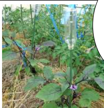
2年 夏野菜 ナスの実 見えますか。