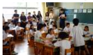
5年社会「暮らしの工夫」