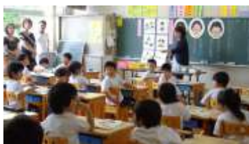
1年国語「わけをはなそう」