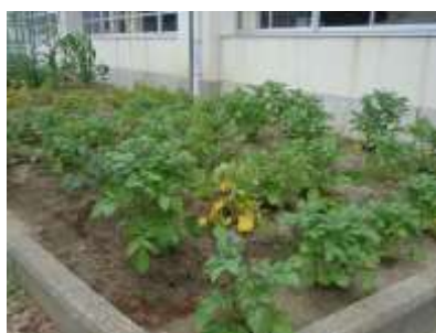
6年と生活教室 ジャガイモ