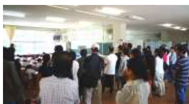
2年算数「ひきざんのきまり」