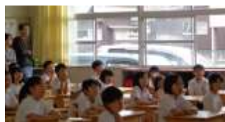
3年社会「地図づくりの発表」