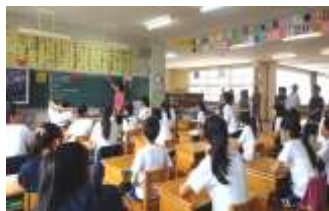
6年道徳「福島を考える」

子どもたちは、おうちの方に学校に来ていただくのをとても楽しみにしています。日曜日でしたから、平日にはなかなか参加していただけない方にもお越したいただき、いっそう張り切っていました。新しい学年になっての毎日をどの子どももよくがんばっているところを見ていただけたと思います。良かったところなど、ぜひ話してやっていただけたらと思います。