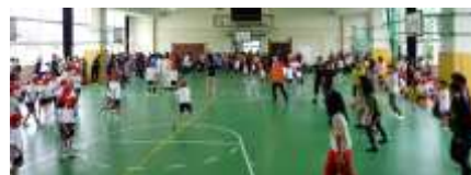
試合開始の合図で「えいっ」

子どもたちが楽しみにしていたもう一つがこの球技大会です。ボールに当たるまいと逃げる子も、ボールに向かっていく子も、実に生き生きしていました。おうちの方々と対戦できるのがとくに楽しい様子で、応援の間も試合の動きをよく見ていました。ある対戦で、保護者チームが相手の子どもチームに強くボールを投げるのを見て、すかさず「大人気ない。」と、見ている子どもから聞こえてきたことがありました。近くの方と思わず笑ってしまいました。今年の優勝は大人チームがとりましたが、みんなよく集中して、大いに盛り上がりました。