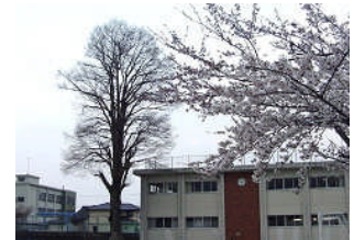
校庭の桜 後ろに落羽松と校舎

今年度も、保護者の皆様と地域の皆様のお力添えをいただきつつ、第一小学校教育を豊かに創っていきたいと思います。どうぞよろしくお願ひ申し上げます。